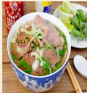
Beef Noodle Soup